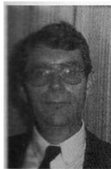
Ben van den Berg Klantengroepen * ELI * OS * Researchsectoren - Bourgonjon - Claasen - v/h Heijmans - Waumans Vakgebieden * E-componenten, incl. ASICS * Test- en meetapparatuur * Computer hard- en software * Optische instrumenten