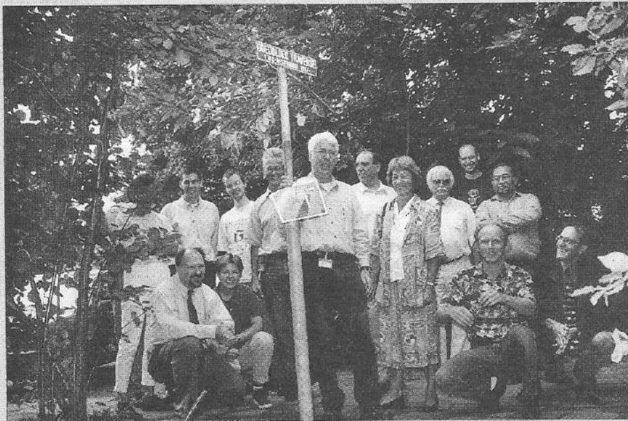
Jap na de onthulling te midden van zijn oud-collega's