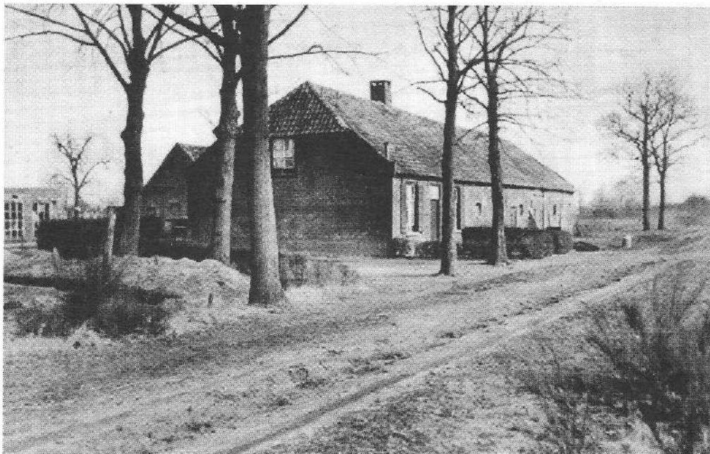
De boerderij rond 1950