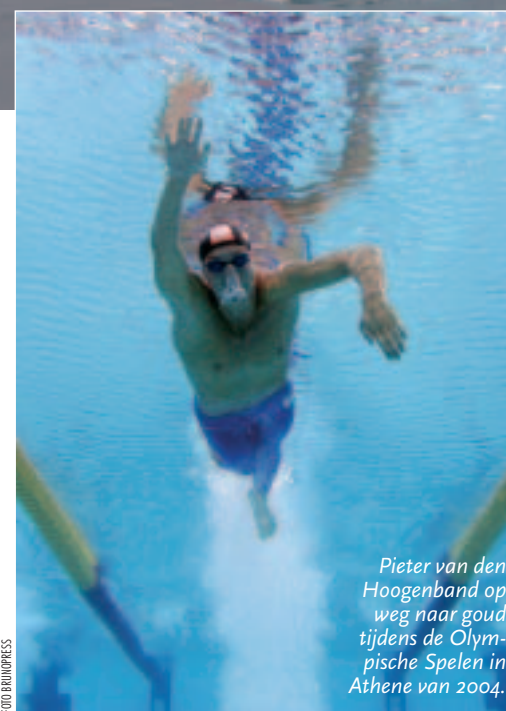
Pieter van den Hoogenband op weg naar goud tijdens de Olympische Spelen in Athene van 2004.

staat immers naar een bak water te kijken.'