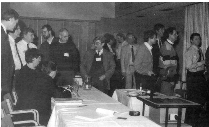
Volop overleg tussen de formele bijeenkomsten.