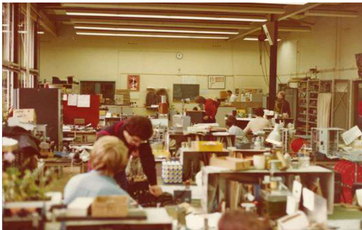
De elektronische werkplaats in WZ omstreeks de jaren zeventig