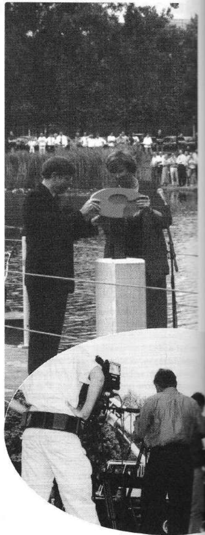
17 juni 1999 Symbolische start van de bouw van de Philips High Tech Campus