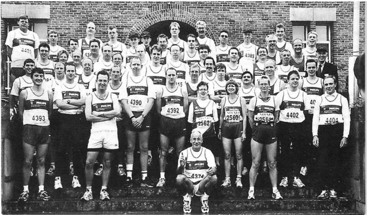
Het team van Philips Research dat deelnam aan de Eindhovense Marathon