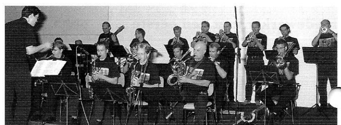
NatLab BigBand: wat een half jaar oefenen en veel talent al niet vermag.